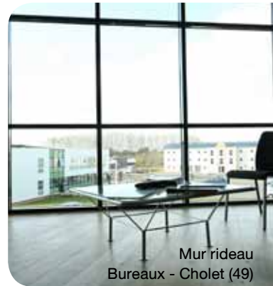
Mur rideau Bureaux - Cholet (49)