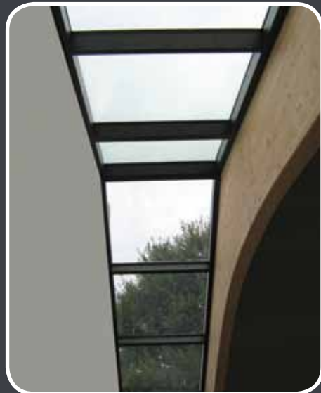
Verrière à 2 pentes - Maison individuelle St Sauveur de Givre en mai (79)