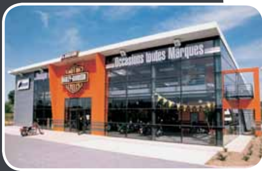
Mur rideau - Magasin Nantes (44)