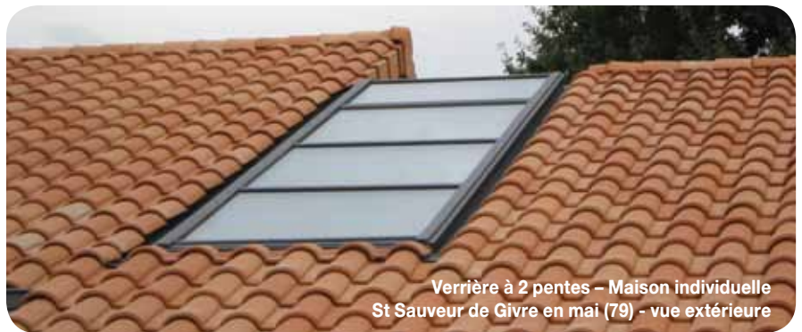
Verrière à 2 pentes - Maison individuelle St Sauveur de Givre en mai (79) - vue extérieure